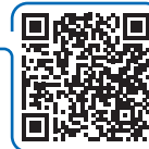
Flood hazard map & information