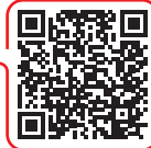
Get your local heat risk