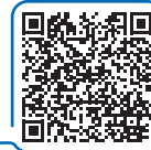
Sandbag stations available in Pima County