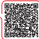
Pima County Heat Relief Network